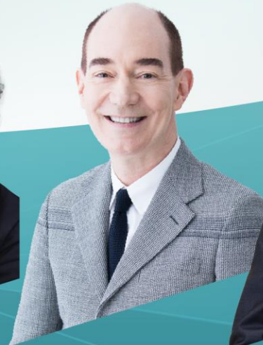
ロバート キャンベル