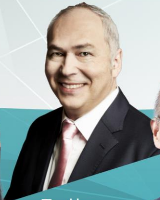
モーリー ロバートソン